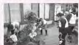
災害ボランティア

昨年度、皆様からご協力いただきました会費を活用して地域福祉活動を実施することができました。