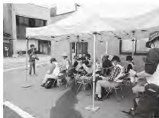
オリエンテーション