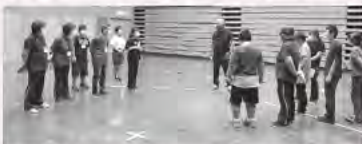
サマーワークボランティア