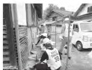
落ちた外壁の撤去